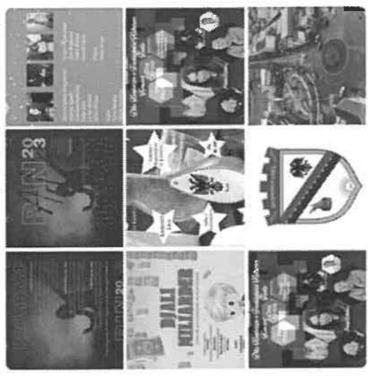
Shiko të gjitha fotografitë

Privatësi - Kushtetë e përdorimit - Reklamimi - Të gjithat e reklamave - Kujtim - Mbrojtja e Nënës së 2023